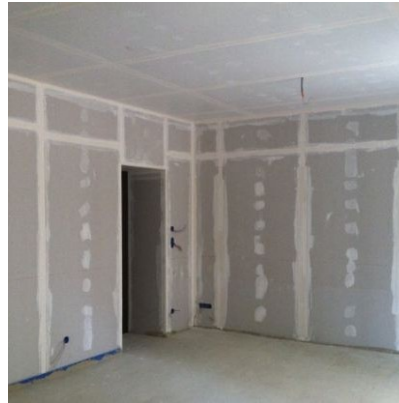
Pose de plaques de plâtre