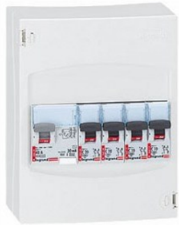
Réalisation de tableaux électriques simples